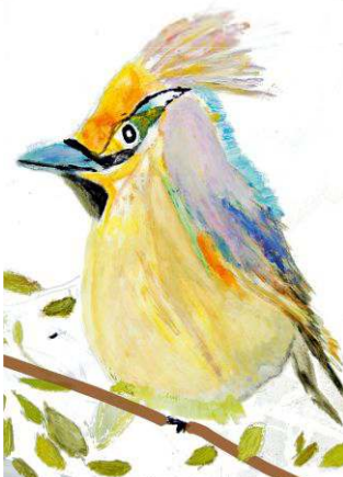
Rys. Joanna Czerwińska

Ptaki zimujące zaczynamy dokarmiać późną jesienią a kończymy wczesną wiosną, kiedy zaczynają samodzielnie zdobywać pokarm. Do karmnika możemy bez obaw wsypać ziarna słonecznika, również w łupinkach, skorzystają z nich wróble, sikorki, kowaliki. Odpowiednie jako pokarm są również nasiona zbóż: prosa, owsa i pszenicy. Natomiast jeśli na gałązkę nadziejemy jabłko ze skórką, możemy się spodziewać wizyty kosów. Ważne aby nie dawać ptakom resztek chleba oraz innych wypieków: ciastek, bułek, gdyż mogą spowodować u nich poważne choroby.