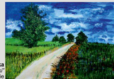
Joanna Czerwińska „Polskie łąki” akryl na drewnie