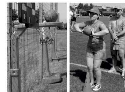
Nasi uczestnicy podczas zmagania w Kowalewie Pomorskim